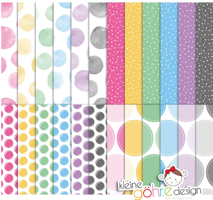
digitale Papiere "Platzen vor Glück Punkte"