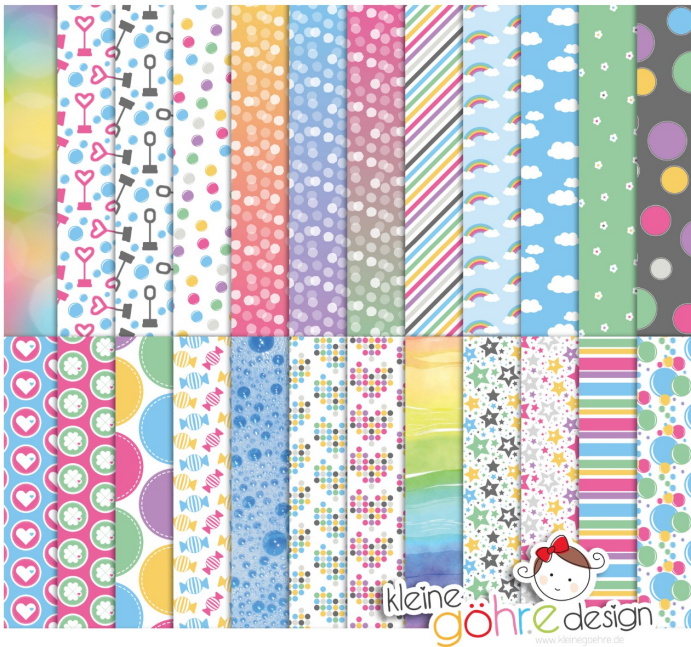
digitale Papiere "Platzen vor Glück Muster"