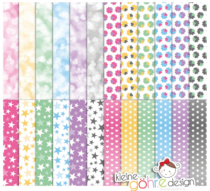
digitale Papiere "Platzen vor Glück Herzen & Sterne"